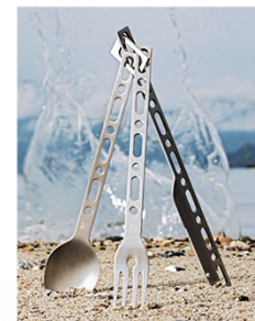
左圖，Virgil Abloh 與 Cassina 合作的「Modular Imagination」模組黑色方塊，讓使用者發揮創意找出新的使用方式。右圖，Abloh 在 Alessi 推出的「Occasional Object」限量餐具組。

Abloh 曾說，建築的設計週期太長，於是透過服裝來快速表達概念，作為經典與時代精神之間的一座橋樑，他離開的太早，但相信明年後年還會有他的設計發表。