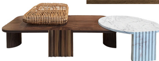
Table basse Coffee table Caravels Collector Group